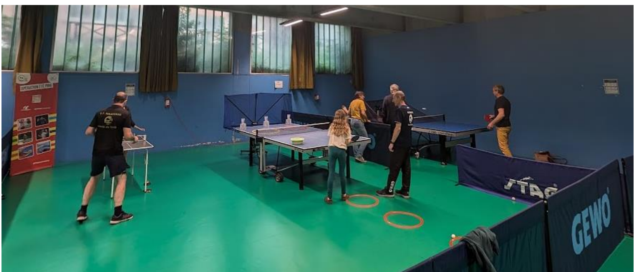
Journée Porte Ouverte en Juin 2024