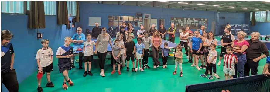
Fête du club en mai 2024

Plusieurs événements se sont déroulés durant ce dernier trimestre avec le tournoi des familles, la fête du club, la journée porte ouverte. De belles heures de ping à partager et à faire connaître. Un grand merci à tous les participants qui ont fait de ces différentes manifestations, de gros moments conviviaux. Bravo à tous.