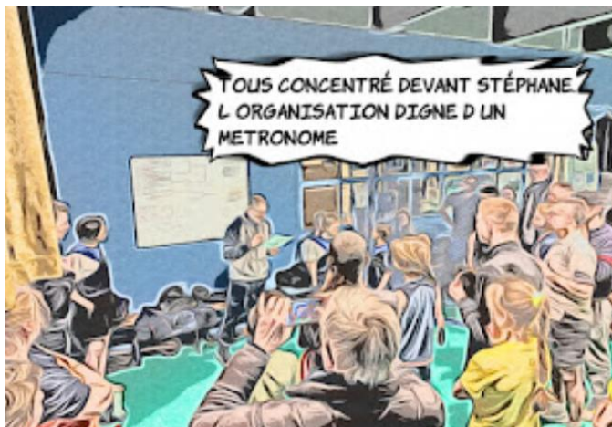
Tournoi des familles en Mars 2024